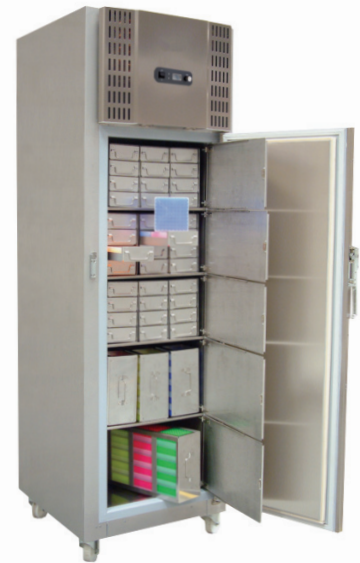
ProfiLine Pegasus PLPE 45..