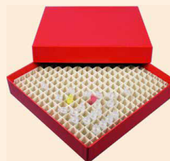
Boxen und Rastereinsätze aus Karton