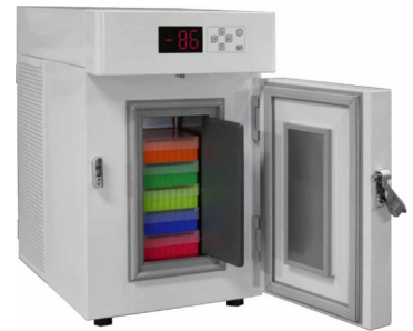
Profiline Pegasus PLPE0186EWN (optional mit Ordnungssystem, sehen Sie dazu den separaten Katalog)