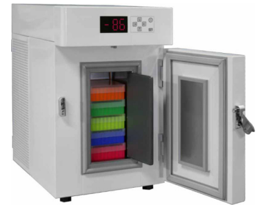
ProfiLine Pegasus PLPE0186EWN (With accessories Inventory Systems. See separate brochure.)