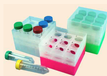
Plastic boxes made of Polypropylene