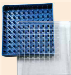
Plastic boxes made of Polycarbonate