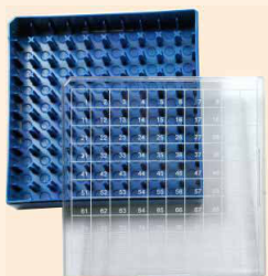
Kunststoffboxen aus Polycarbonat