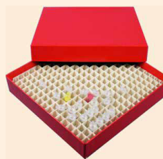
Boxes and grid dividers made of fiberboard