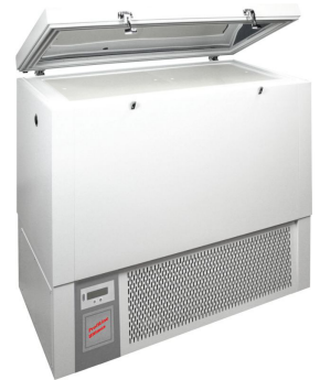
ProfiLine Ultimus PLULC33501